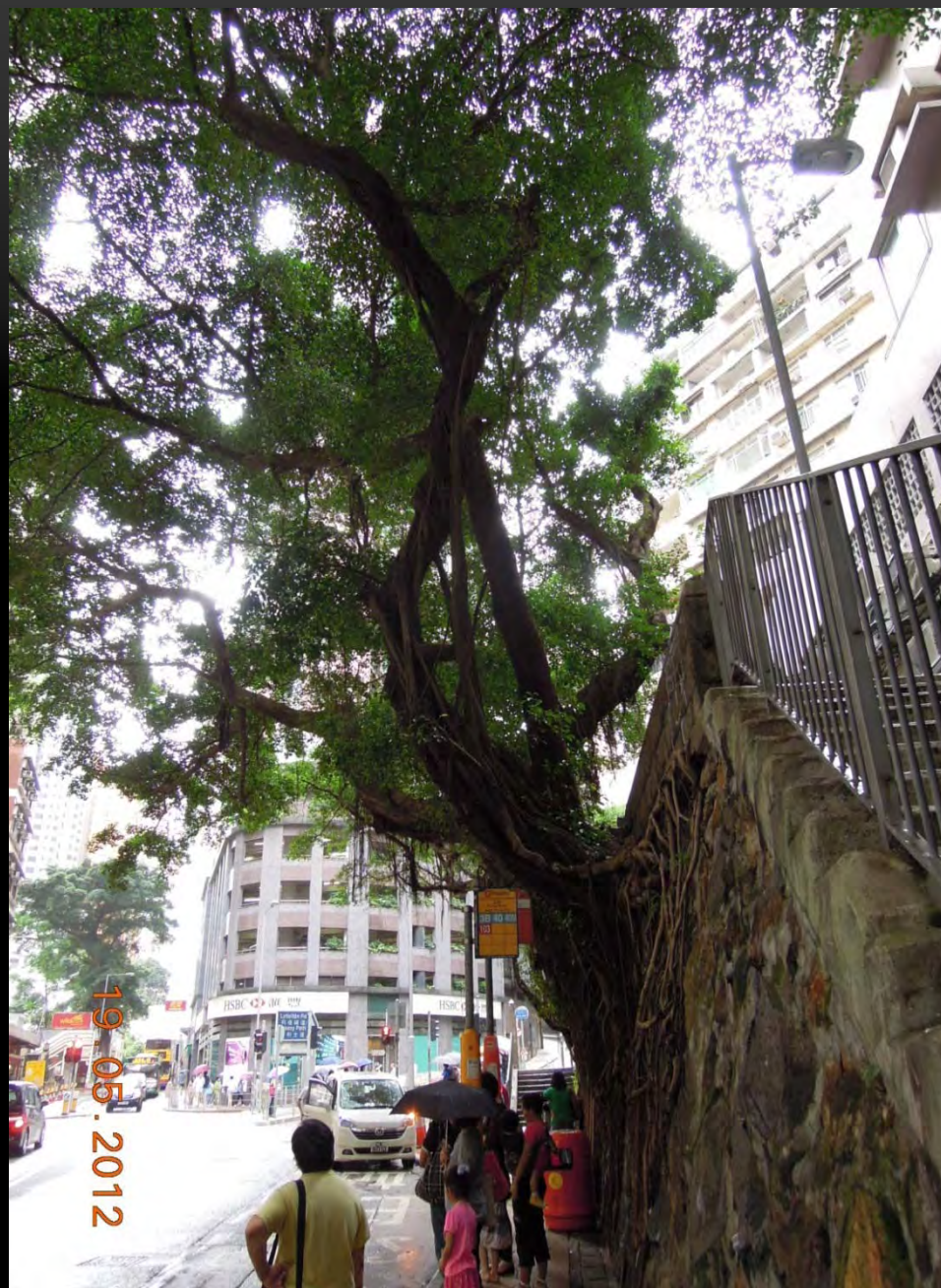
由不同角度觀察的石牆 樹