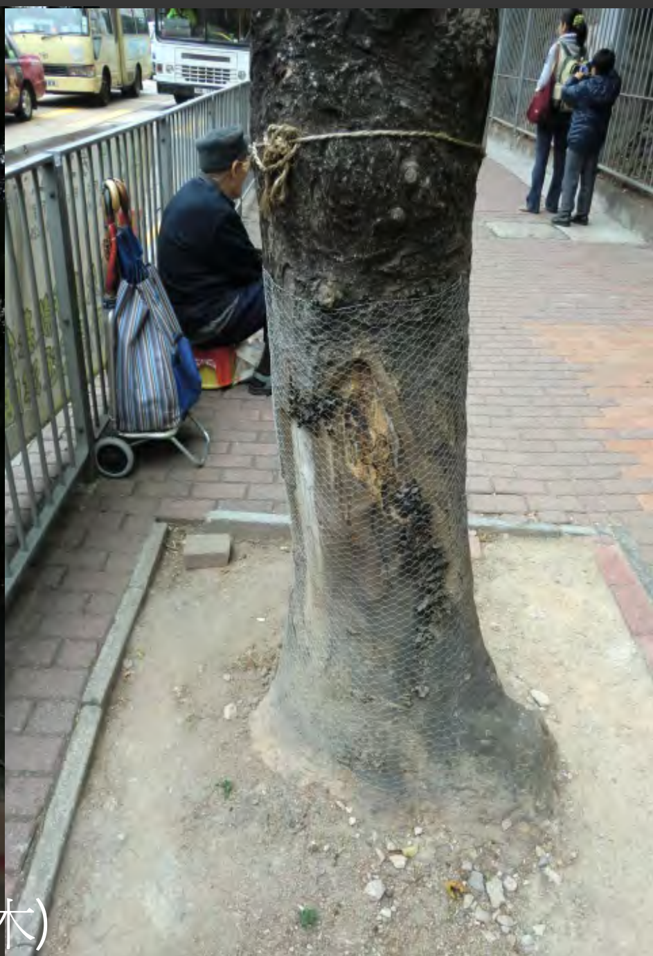
在太子道上的樹頭菜(魚木)