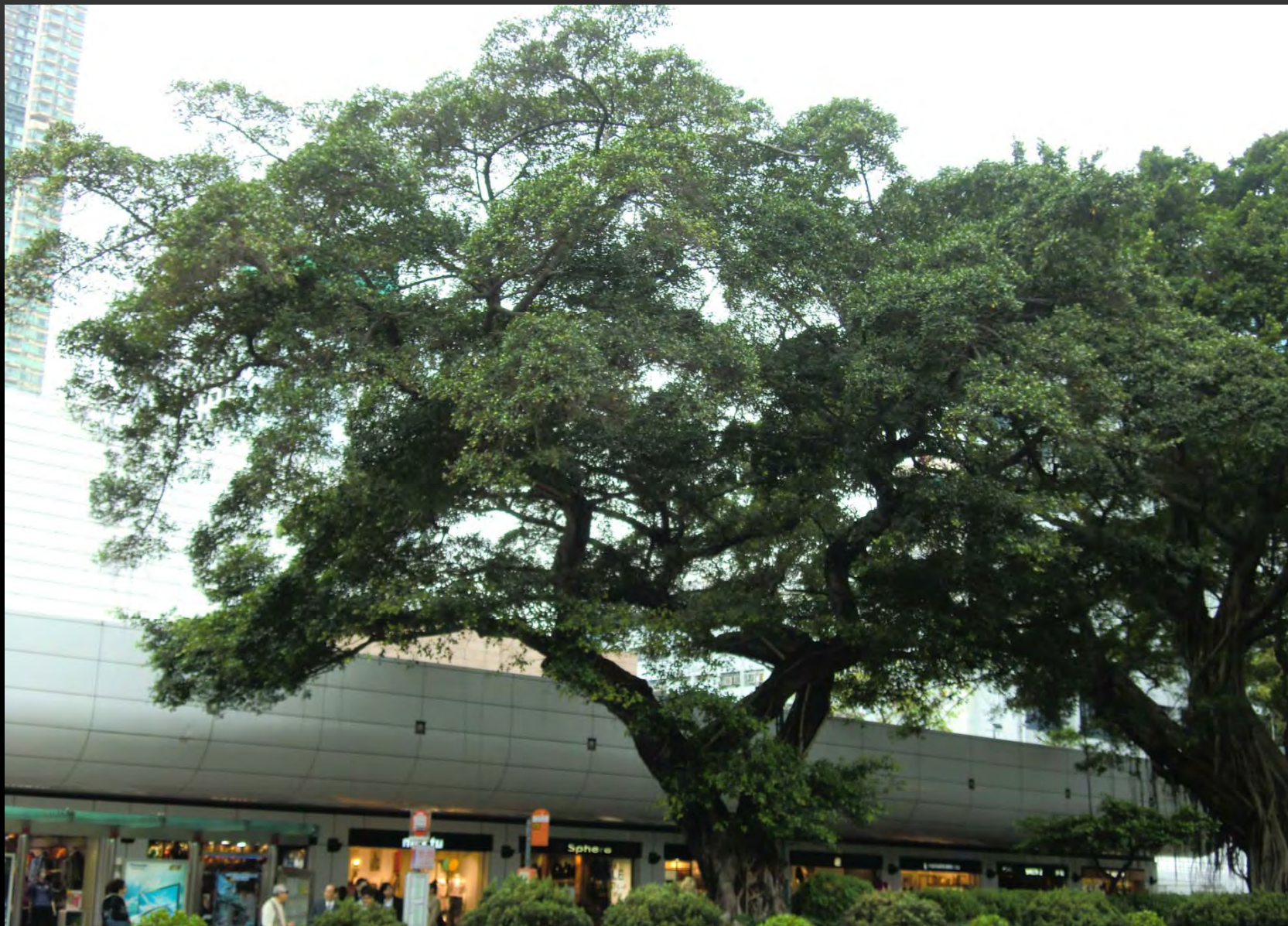
在尖沙咀彌敦道上的老榕樹